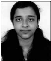
ബുജ ഹന്ന രാജ് സെന്റ് ജോർജ്ജ് ആലാ പൊതുവിജ്ഞാനം ഭദ്രാസനം -1st